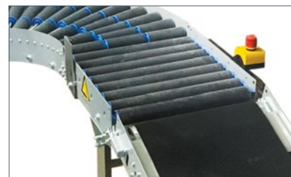
Bande élévatrice pour rallonger les chemins et pour une meilleure ergonomie

Nous nous réservons le droit d'effectuer des modifications sur les caractéristiques sans notification préalable. Bien que tous les efforts soient consentis pour délivrer dans ce document des informations précises, TOMRA ne saurait se porter responsable des erreurs, inexactitudes ou omissions qui pourraient se produire.