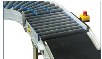
Ook opvoerbanden leverbaar

We behouden ons het recht voor om veranderingen door te voeren zonder voorafgaande kennisgeving. Hoewel er alles aan is gedaan om ervoor te zorgen dat alle informatie in dit document nauwkeurig is, aanvaardt TOMRA geen aansprakelijkheid voor eventuele onjuistheden.