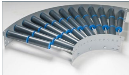
In diverse afmetingen en bochten verkrijgbaar