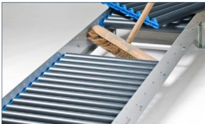
Eenvoudig schoon te maken